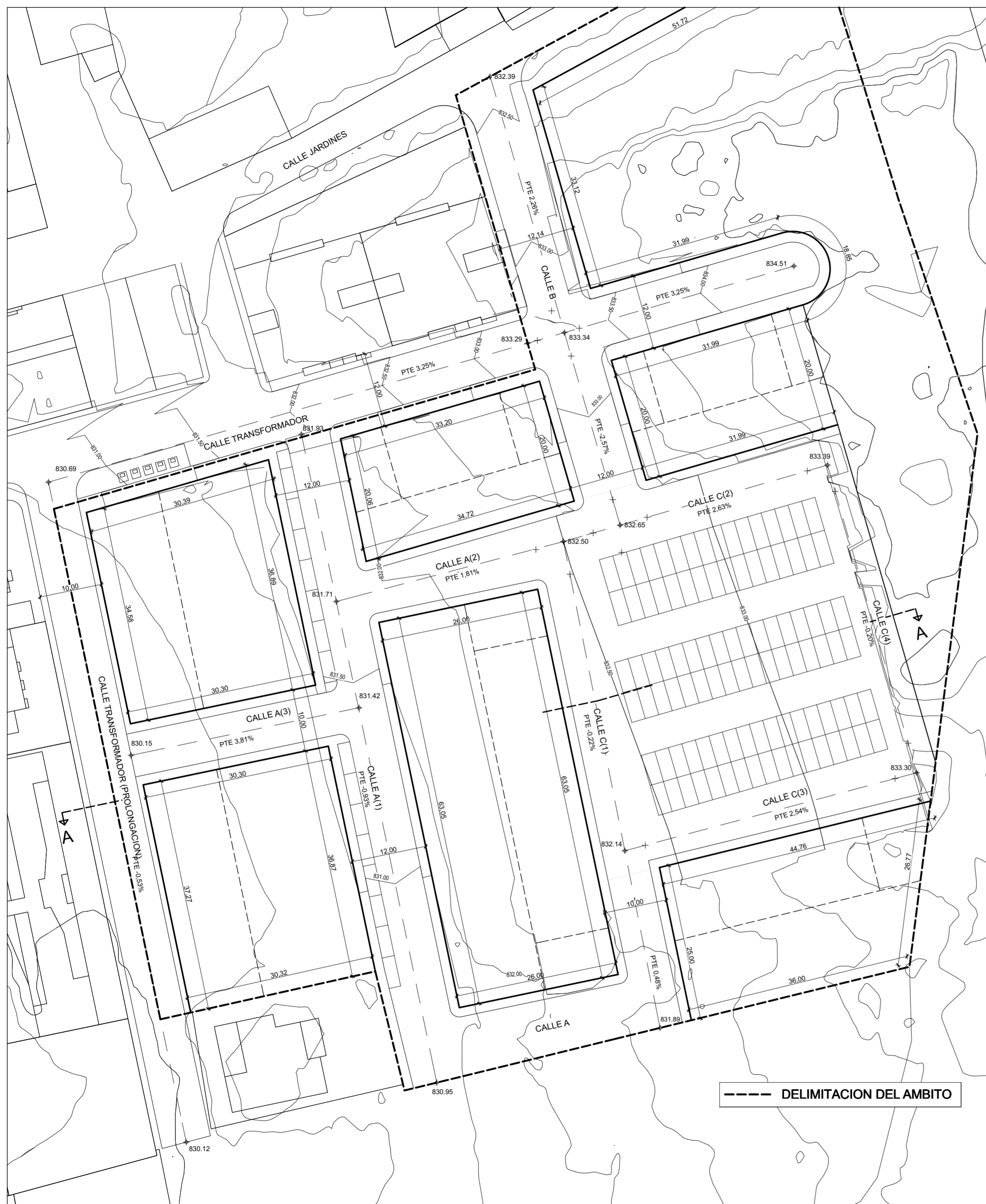
ALINEACIONES Y RASANTES